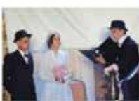
Les mariés écoutent le maire.