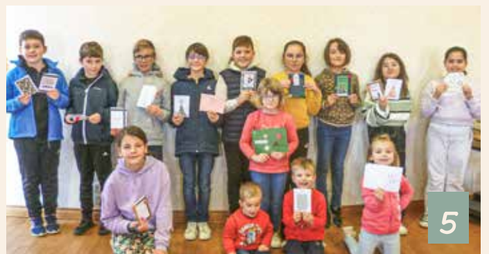
1. Obtention de la première fleur Villes et Villages fleuris • 2. La Joséphine - Première édition à domicile. • 3. Entretien du cimetière. 4. Soirée de remerciements aux bénévoles • 5. Fabrication des cartes de voeux pour les aînés.