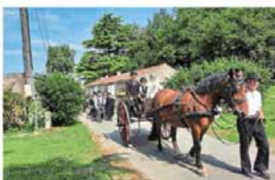
Les mariés arrivent à la mairie.