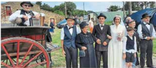
Les mariés, leurs parents et l'accordéoniste.

Après le vin d'honneur, place à la présentation de l'arbre généalogique de la famille. Flaubert exposé dans l'étable, suivi du repas de noce animé